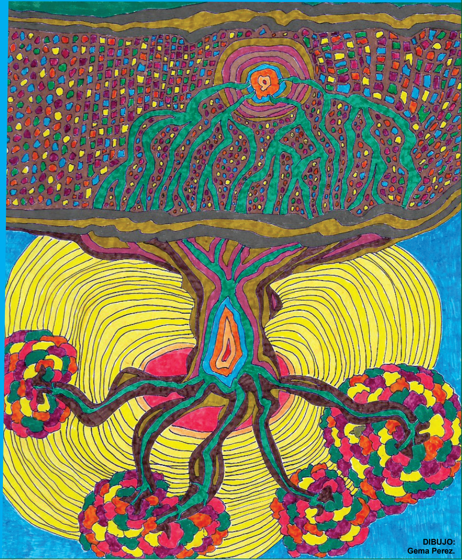
DIBUJO: Gema Perez.