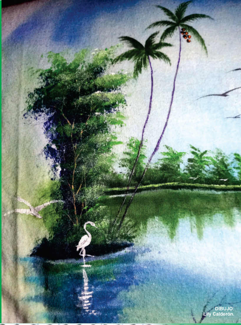
DIBUJO: Lily Calderón.