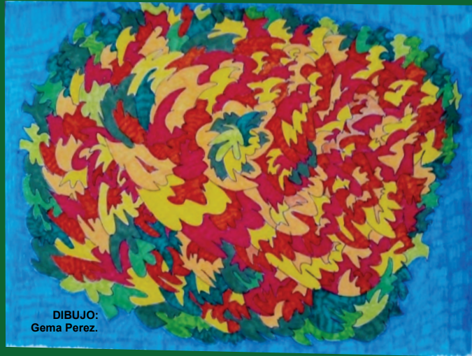
DIBUJO: Gema Perez.

Nas escolas e universidades Remamos contra as correntezas do machismo Sinodalizando saberes Partilhando as razões do nosso esperar e do nosso acreditar