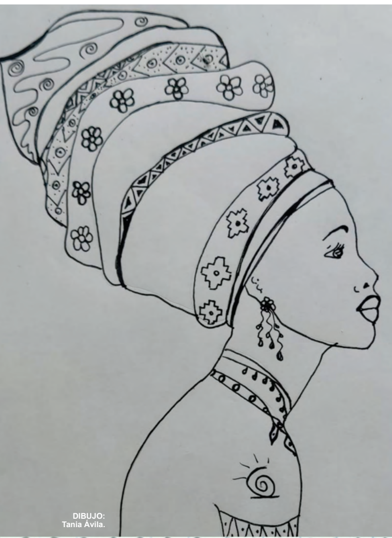
DIBUJO: Tania Avila.

En los ríos del Amazonas, pescamos nuestra comida, alimentamos nuestra fe en Dios encarnado en solidaridad con nuestras causas.