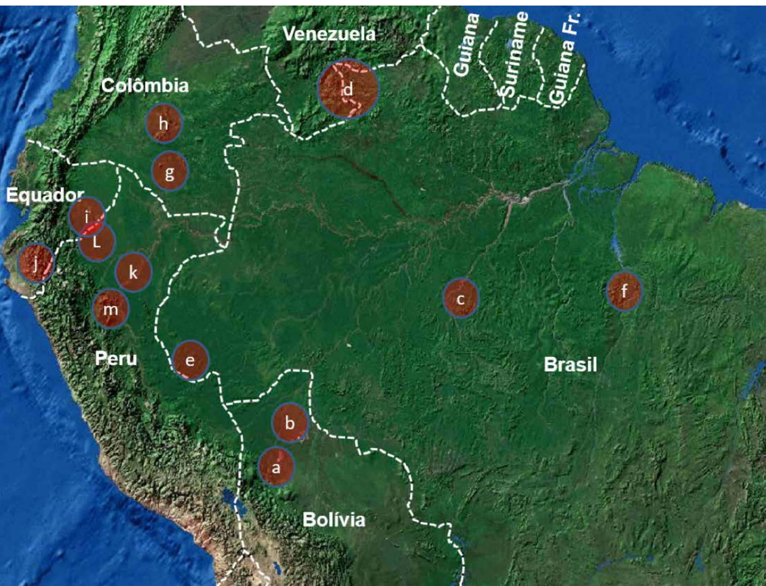
Mapa de ubicación de los trece territorios que formaron parte del proceso de Escuela de DDHH de la REPAM.